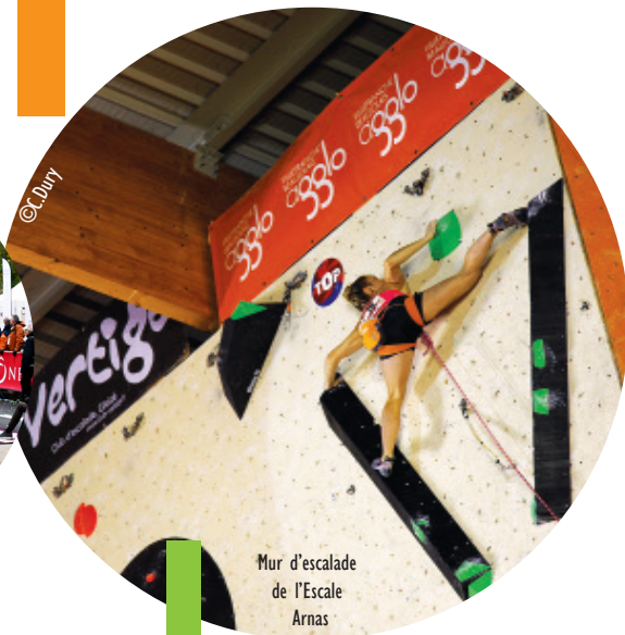
Mur d'escalade de l'Escalade Arnas