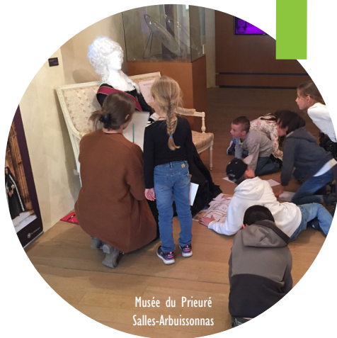
Musée du Prieuré Salles-Arbussonnas