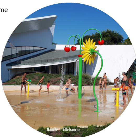
Nautile - Villefranche