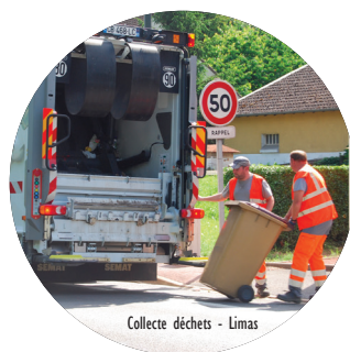
Collecte déchets - Limas

L'Agglo investit, aux côtés de l'Agence de l'Eau, dans un programme d'actions à hauteur de 48 M€ en faveur de la qualité de l'eau et la préservation du milieu naturel.