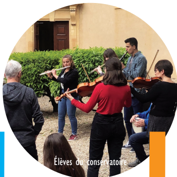
Élèves du conservatoire