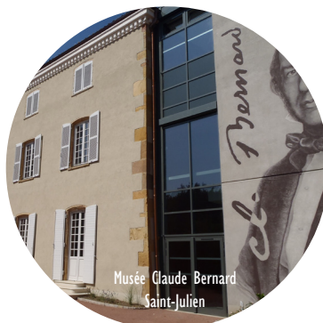
Musée Claude Bernard Saint-Julien