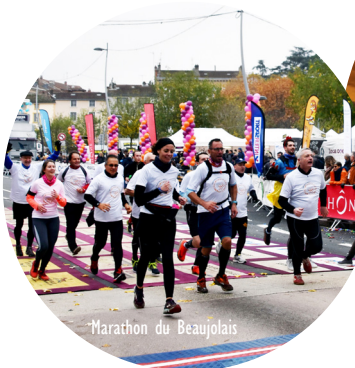
Marathon du Beaujolais